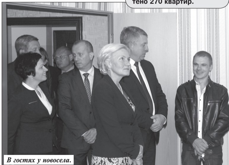
В гостях у новосела.

Объем средств на строительство жилья для детей-сирот в Брянской области вырос с 2014 года почти на четверть и составил 226,8 миллиона рублей. На эти деньги в 2016 году в регионе будет приобретено 270 квартир.