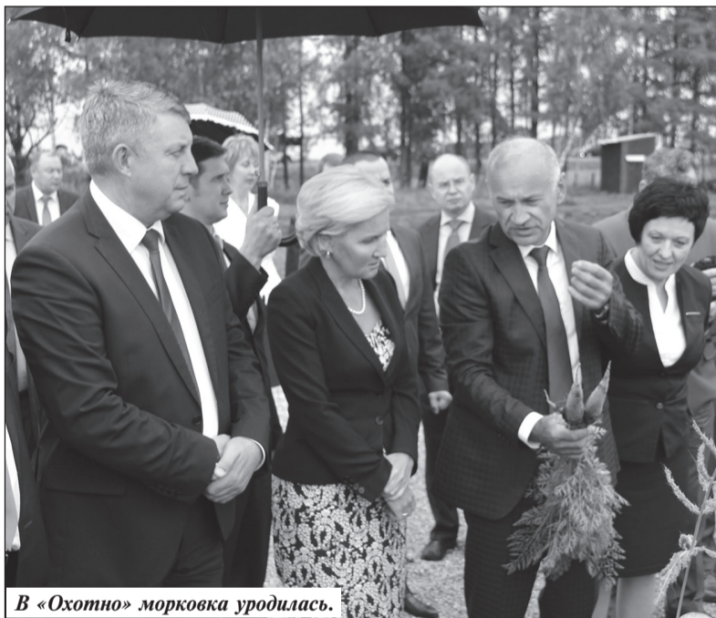
В «Охотно» морковь уродилась.